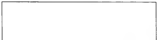
Схема границы эксплуатационной ответственности

Организация водопроводно- канализационного хозяйства